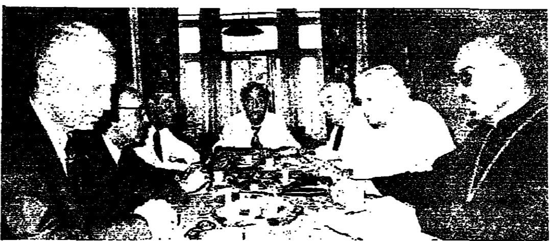
اركان الجبهة اللبنانية خلال اجتماعهم في بكيفيا امس

اعلان الرئيس كميل شمعون في ختام اجتماع الجبهة اللبنانية ظهر امس ، ان الجبهة تلقت دعوة رسمية لزيارة دمشق ، وانها وافقت على طيبة هذه الدعوة ، بانتظار تحديد موعدا في وقت قريب .